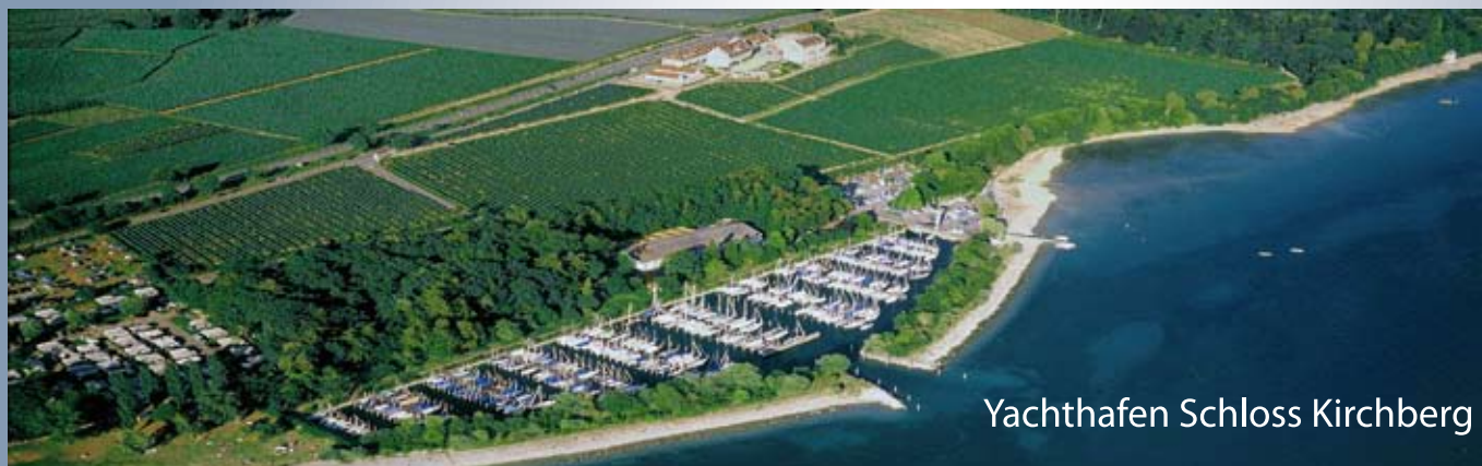
Yachthafen Schloss Kirchberg

Wir garantieren einen Liegeplatz bei Kauf einer Sunwind Yacht.